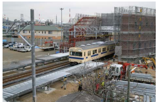
工事は着々と進行しています

和木駅には、1日当たり上下140本の列車が停車します。通勤、通学、通院、お買い物など、多くの方のご利用をお待ちしています。